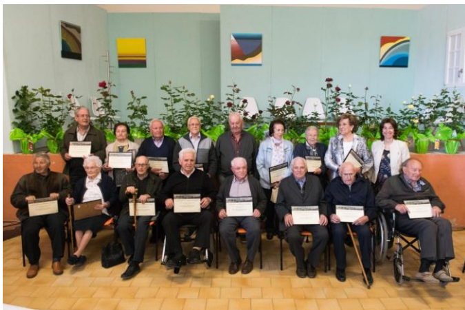
Foto general de tots els homenatjats

L'alcaldesa els dirigí unes paraules i els feu entrega d'una certificació emmarcada com a record d'aquest dia, a més d'un roser florit per cadascun d'ells. Tots els presents van rebre l'homenatge agraiats pel record i la festa.