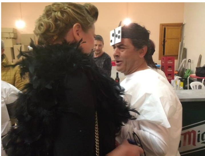
Els que han vestit la disfressa arriben a la sala