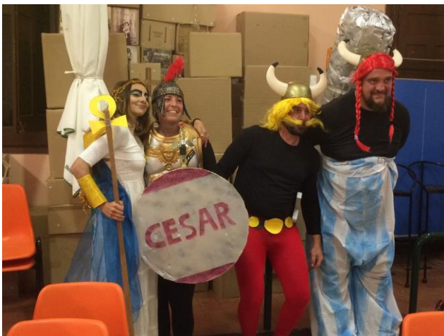
Família ben preparada pel que pugui ser...