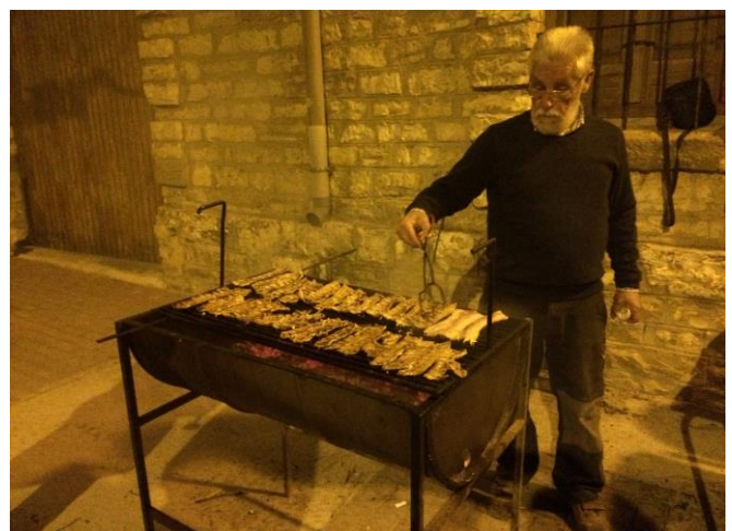
Expert en fer brasa i coure la carn

Organitzada pel jovent, sempre però amb el fogoner en cap encarregat de mantenir el foc i coure la carn. Mentre, dins de la sala de la vila, els joves van parant taules i preparant les amanides.