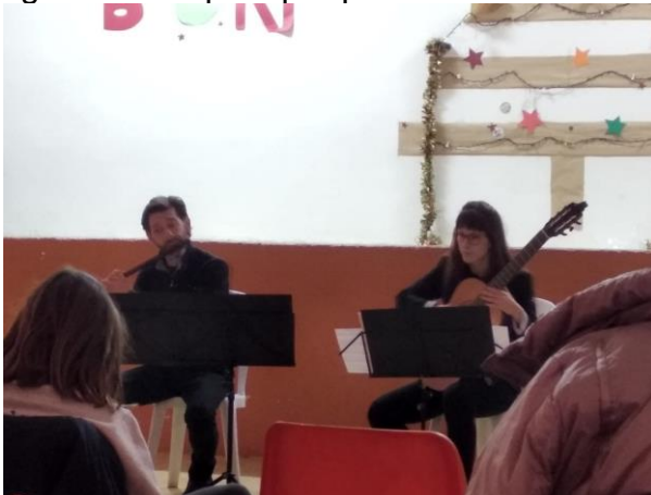
Concertistes en plena actuació

> El dia 12 de gener a les 7 de la tarda, Concert familiar de flauta i guitarra . RITMES TREPIDANTS a la sala de la vila. Bona assistència de públic amb satisfacció i ganes de repetir per part de tots