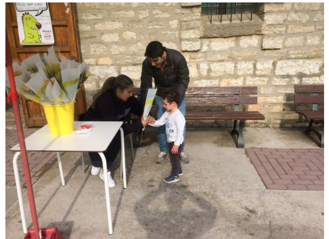
Els actors, aliens a l'escena que protagonitzen

El sol va somriure pràcticament tot el dia i el pas pel carrer, carretera de la població, per unes hores va canviar el decorat. La dolça escena que vam poder captar de ben segur va espantar tots els mals dracs de la rogalia. Només a la porta del bar el cartell anunciador de la venda de roses, un drac rialler anunciava la festa.