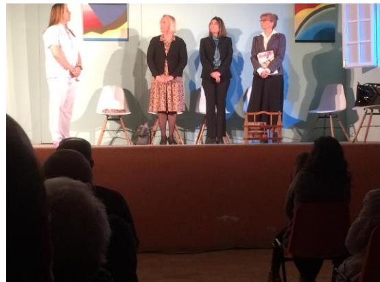
Escena del quadre teatral

A les set la tarda Teatre a la sala de la vila a càrrec del grup "BAT" de Tàrraga amb la presentació de la comèdia "Revisió Anual" (mai no és tard) de Montserrat Cornet L'obra tracta d'una tragicomèdia que no dona solucions, però que intenta transmetre la il·lusió en la vida dels personatges.