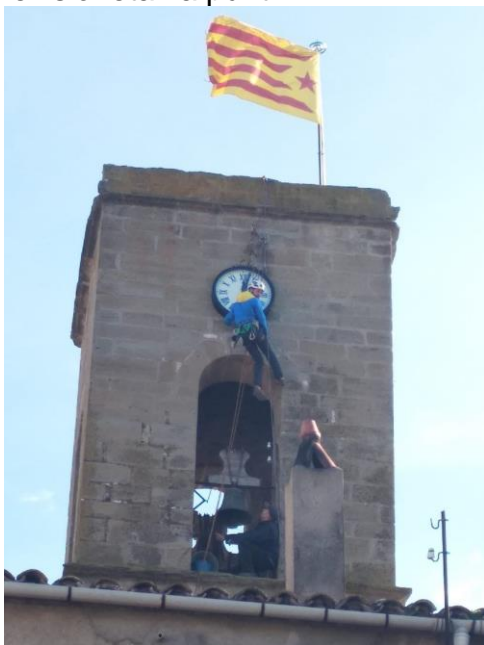
Col·locació de l'esfera en el seu lloc

> Ja tornem a tenir el rellotge al campanar amb revisió feta i a punt.