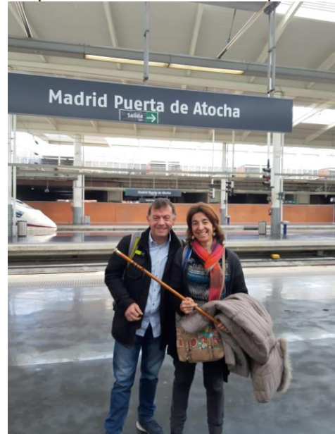
l'Alcaldessa i la seva parella a Atocha

compareixences dels agents de la Guàrdia Civil i la Policia Nacional durant el judici del procés que es fa al Tribunal Suprem.