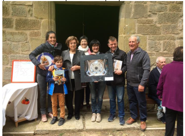
Tots els afortunats en el sorteig i els majorals

Com ja és costum, per la proximitat de Sant Jordi, cada any es sortegen uns llibres, alguna fotografia emmarcada referent al patrimoni de Tarroja i algun altre detall per arrodonir comptes i anar omplint la bossa per les obres de patrimoni que prou falta fa.