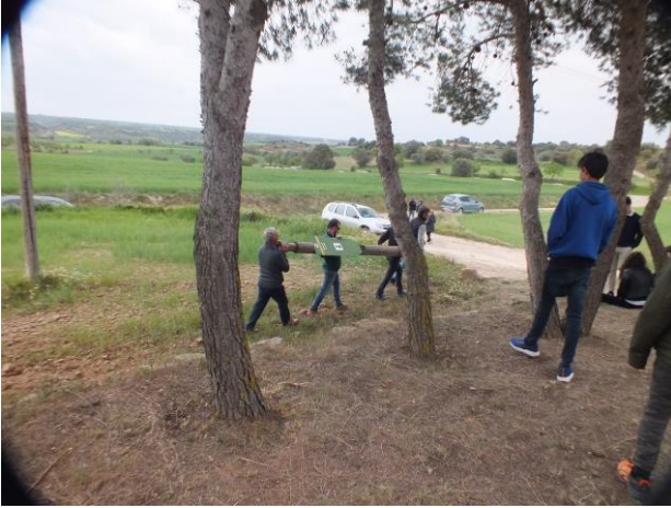
Una acció vandàlica va fer caure el cartell