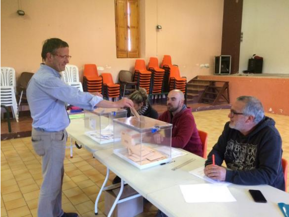
Mesa de votació amb un votant

> Diumenge 28 d'abril Eleccions a Corts generals 2019