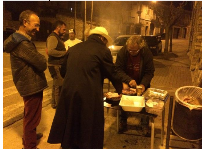
Preparació de la carn per la graella

> Festa de Carnaval. Com cada any, els que van tenir ganes de disfressa així ho van fer. Per a tothom hi va haver sopar amb graellada de botifarra i cansalada, pa torrat, amanida i postres