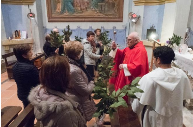
Moment de la benedicció del rams

La nostra societat no canviarà, si cadascun de nosaltres no fem un pas endavant de comprensió, de suport, de generositat, per