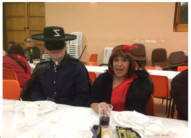
El Miquel i la Carne