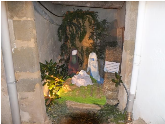
Pessebre artesà, fet de drap. Portal de cal Notxes