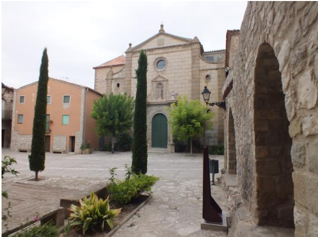
Plaça de l'església, part central de la façana restaurada

> Obres a la façana de l'església. El passat mes de juny van començar les obres de restauració de la façana de l'església, a causa del mal estat en que es trobava. El pressupost de l'obra es de 16.685,59 euros.