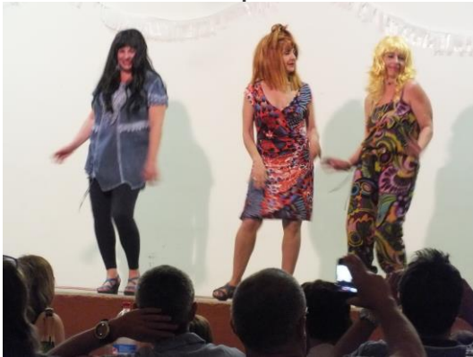
Imitació "Les Ketchup"