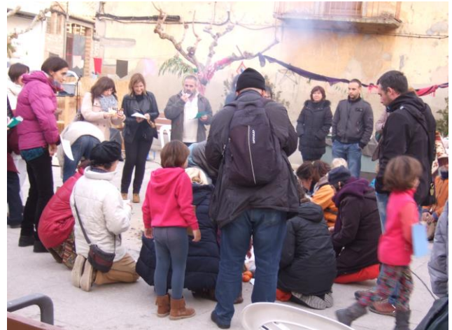
Taller-cerimònia de Creació de Relitat