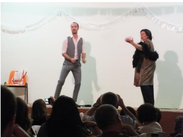
Imitació F. Mercouri i M. Caballé

Dissabte 1 d'agost a les 10 jocs de cucanya a la plaça Nova.