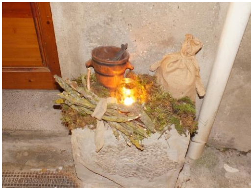
Detall al costat de la porta d'una casa

que han visitat els pessebres, perquè ens han infós ànim i ganes de tornar-hi. A tots els que han col·laborat amb el desig i amb el suport. Moltes gràcies.