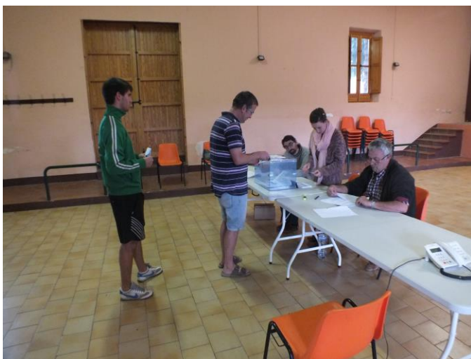
Votants a la mesa, a punt d'entregar el vot

> Des de l'Ajuntament ens comuniquen que s'ha obert un nou espai de comunicació en "twitter" en el qual es van penjant notícies d'interès .