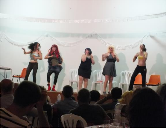
Imitació "Spice Girls"