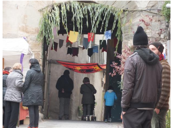
Portal de la plaça Nova guarnit

comença, els organitzadors han creat aquesta fira amb la intenció de celebrar, compartir, conèixer-nos i nodrir-nos. Tarroja es va vestir de festa, carrers, portals, portes de les cases, tot engalanat de fira, amb molt de gust. Parades al carrer