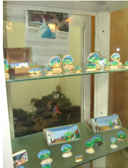
Pessebres miniatura, entrada de cal Moixet

A la placeta del carrer Baix es va fer un bon foc en el qual vam torrar pa i tothom qui va fer la ruta del pessebre va poder gaudir de bones torrades sucades amb oli.