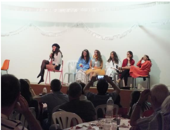
Una mica de tot