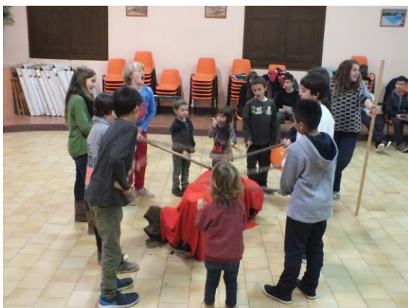
Moment de fer cagar el Tió

Més tard a la mateixa sala de la vila la mainada va fer cagar el Tió sota la mirada atenta de pares, padrins i veïns del poble, mentre tots plegats vam fer un bon tast de neules i torrons.