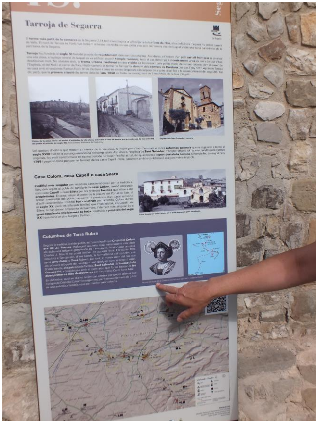
Plafó col·locat a la plaça de l'Església

➤ El passat mes de setembre a través del Consell Comarcal de la Segarra van ser col·locats uns tòtems turístics o plafons amb informació de la vila a la plaça Vella i a la placeta de la font, camí de Sant Antoni. Orienta als visitants de la nostra història i també els indica rutes a seguir.