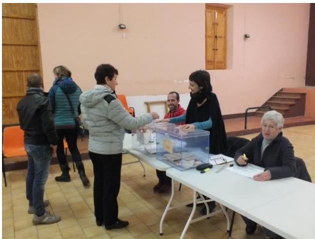
Mesa constituïda i votant

> Pessebres al carrer. L'Associació de dones "El Lilà" aquestes festes ha omplert de vida nadalenca els carrers de Tarroja. La mateixa nit de Nadal a la sortida de missa es va fer un petit recorregut per visitar els pessebres que aquest any s'han realitzat en el centre de la vila, des del carrer Baix fins al portal d'entrada de cal Notxes.