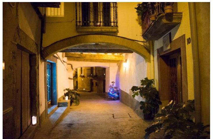
Carrer Església la nit de Nadal

El cementiri que era a tocar del campanar, carrer de la rectoria, va ser traslladat fora vila.