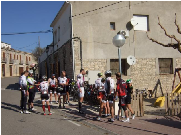
Ciclistes a punt d'esmorzar a la sala del Bar

Tarroja quedaven assenyalats per una ruta ciclista que la "Penya ciclista" de Cervera havia organitzat, van participar un centenar de ciclistes, veterans, joves i algun infant. Els ciclistes van començar a passar pels carrers de la vila cap a les 11 i solitaris o bé a petits grups, sabent que eren cronometrats no valia a badar. Una vegada la cursa acabada es van reunir al Cafè on l'Stephan els tenia preparat un esmorzar-dinar de brasa que convidava a llepar-se els dits.