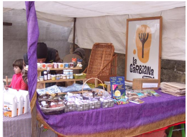
Una mostra de parada de les que hi van haver.