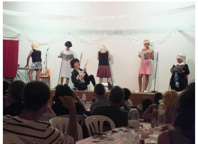
Grup imitant "Queen"

A la mitja nit Escala en Hi-Fi en el qual van participar jovent i no tan jovent de la vila o vinculats a ella. Ens van distreure, ens ho van fer passar bé, vam riure força i ens vam haver d'esforçar en pensar qui hi havia sota la vestimenta de l'artista, que molts cops no vam saber endevinar.