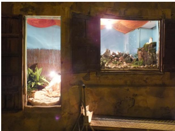
Pessebre posat a l'espai de l'antiga carnisseria

> Pessebres al carrer. L'Associació de dones "El Lilà" aquestes festes ha omplert de vida nadalenca els carrers de Tarroja. La mateixa nit de Nadal a la sortida de missa es va fer un petit recorregut per visitar els pessebres que aquest any s'han realitzat en el centre de la vila, des del carrer Baix fins al portal d'entrada de cal Notxes.