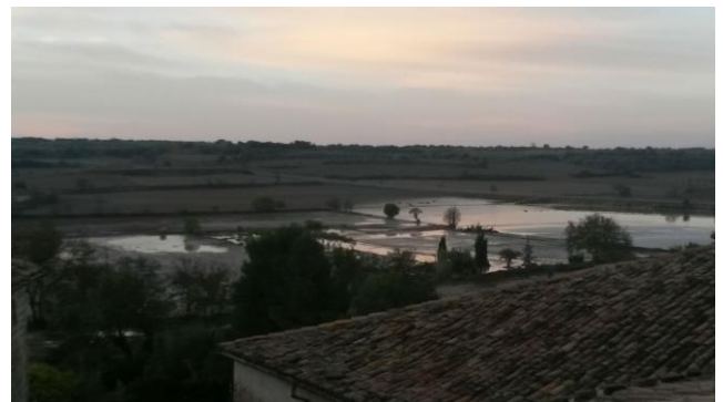
Camps enllacats per la rubina i el fang

Els nostres padrins, amb la saviesa popular que els caracteritzava ja ho deien: "Si vols dormir tranquil, no facis el niu vora del riu"