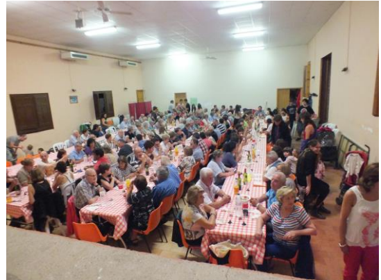
Sopar de Festa Major

Bingo de Festa major, recollida de 460 euros, que van destinats a Endreçem el patrimoni.