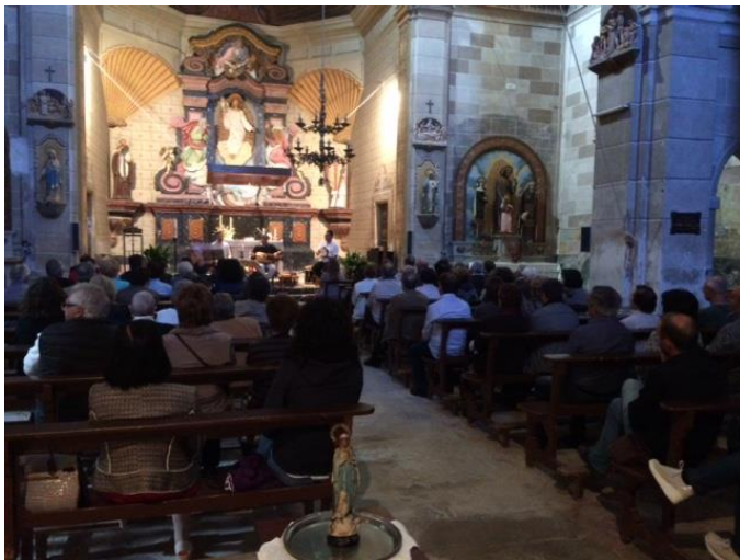
Públic que assistí al concert

general, com la viola de roda, els panderos quadrats, també força inconeugut actualment, amb els quals ens van sorprendre gratament, amb el pregó anunciador del concert, al migdia, a la sala de la vila abans d'acabar l'acte, així mateix van obrir el concert de la tarda a l'església, passant des de la porta d'entrada fins a l'escenari.