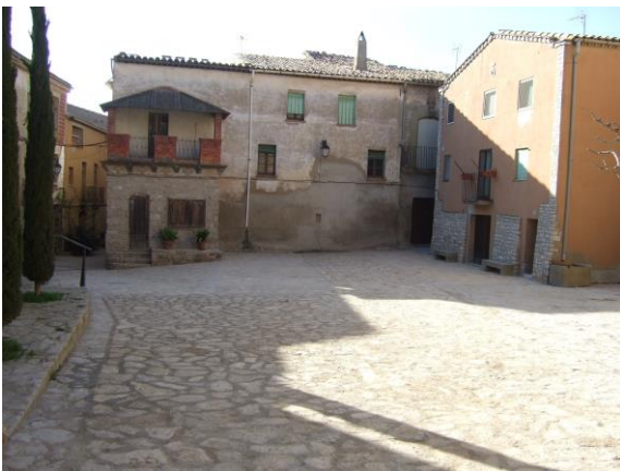
Imatge de la plaça amb l'antiga carnisseria al fons

El cost total de l'actuació ha estat d'uns 50.000 euros, dels quals 25.000 han estat aportats per la Diputació de Lleida mitjançant una subvenció, 15.000 euros d'una altra ajuda de la línia d'aigües i els 10.000 euros restants s'han aconseguit d'una partida de manteniment i conservació del PUOSC de la Generalitat."