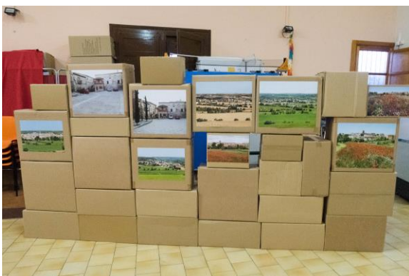
Mostra de fotografies, Tarroja i entorn

També una simpàtica mostra, de col·lecció "ous Kinder". Centenars de petites figures van prendre vida sobre l'expositor de la sala amb la mirada atenta dels infants delerosos de poder-les tenir a les mans, no gens menys molts adults que per uns instants van somiar amb el joc de les petites figures i el