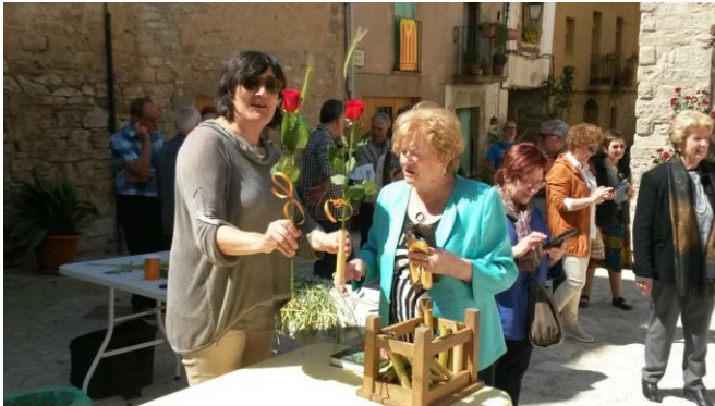
Venda de roses