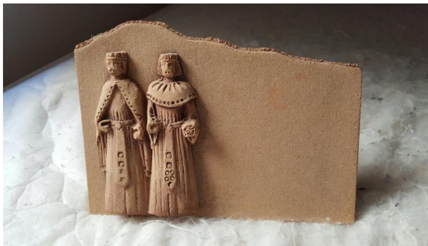
La Senyora del castell de Torroja i el Vescomte de Cardona. Representació figurada

Com és sabut, la composició de l'escut de Tarroja porta impresa una torre i ambdós costats, dreta i esquerra un card, es refereix a la unió de les cases de Torroja i Cardona.