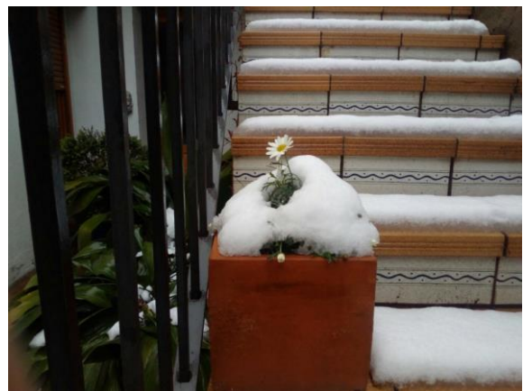
Podran arrencar totes les flors, però no podran aturar la primavera

La neu, en molt bon estat, segons diuen els entesos, ha fet més llarga la temporada d'esquí, que ha arribat fins a les vacances de Setmana Santa sense dificultats. A la plana Segarra no solem gaudir de grans nevades, aquesta però va trencar branques d'arbres i va fer caure alguna paret. D'aquesta nevada, més aviat ens volem complaure en la petitesa que la neu ens va deixar a peu d'escala. Vegeu la delicadesa que ens va enviar la Carme Segura, atenta sempre als petits detalls.