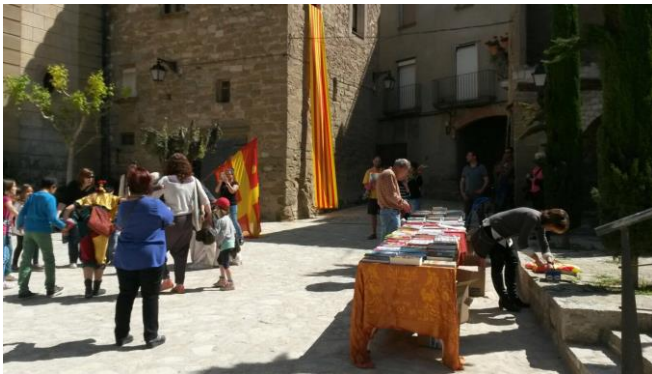
Parada de llibres, ambient de festa