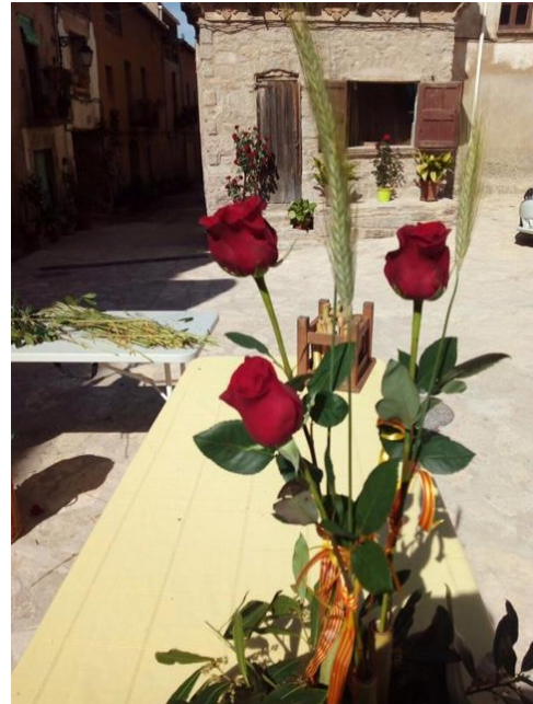
Dia de Sant Jordi

"Ramon de Torroja regent del Regne d'Arborea" , podem observar a través de la descripció l'abast del cognom Torroja i la vinculació amb la nostra vila.