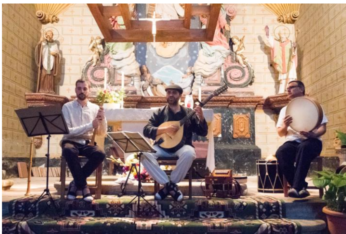
"Els Bons Homes", preparats per actuar

Un concert amb molta qualitat, que va deixar satisfet a tothom. Van utilitzar en el cant i en la declamació, el llenguatge de l'època; galaicoportuguès, llatí, sefardita i un romanço amb català antic, finalitzant el concert amb alguna peça de folklore, marcant el punt final amb l'himne d'homenatge a Occitània, "Montanhes Araneses", la qual va ser ovacionat amb molts aplaudiments.