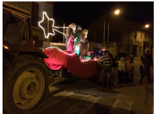
Arribada de SS els Reis a la sala de la vila

convivència, els retrets al respecte queden ben palesos en la seva elocució.