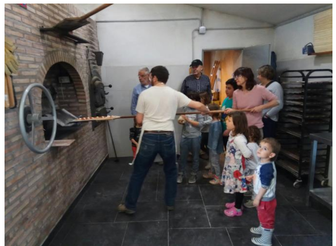
Enfornant el pa

Enfornar el pa, la coca..., esperar amb neguit el resultat per a poder-lo tastar i convidar als de casa que no ha pogut viure l’experiència.