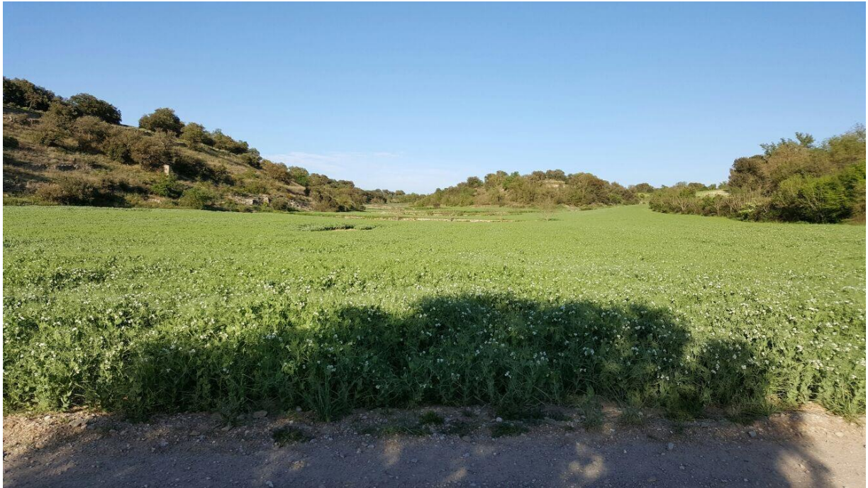
La coma d'En Torroja (Comontarroges actualment)