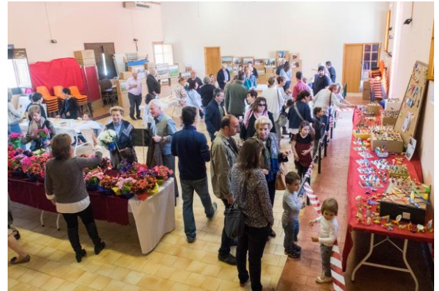
Sala de la vila, públic assistent, venda de flors, "Expo"