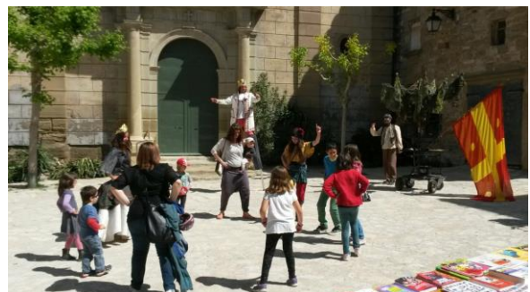
Escenificació de la llegenda de Sant Jordi

Els diners de la recaptació són incorporats a la borsa de "Endrecem el Patrimoni", per la continuació de l'obra que l'any 2014 es va iniciar amb veïns voluntaris la neteja de la sagristia.