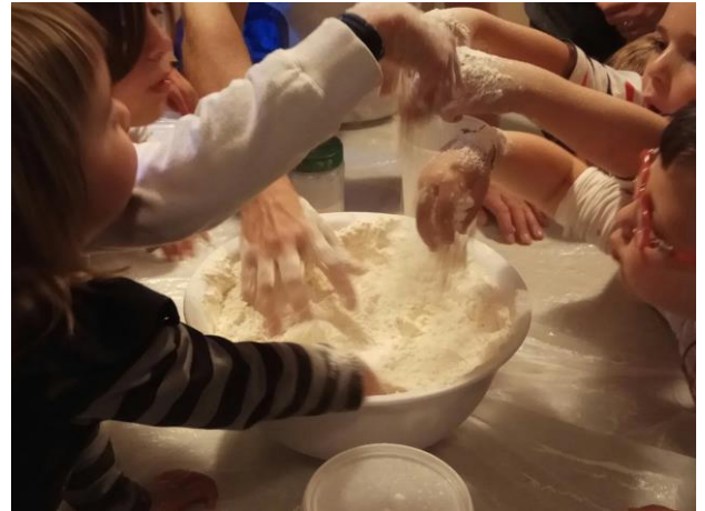
Tots remenen la massa per fer el pa

- Dissabte 6 de maig, taller lúdic per tots els nens i nenes, on van poder elaborar ells mateixos pa, coca ... entenent el significat de l’alimentació sana, a càrrec de David Arjona.